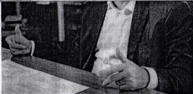
PREFEITO de Fortaleza, Evandro Leitão (PT)

A reforma traz ainda artigo sobre a Autarquia Municipal de Trânsito e Cidadania (AMC), que passa a ser vinculada ao Gabinete do Prefeito, com status de autarquia especial. Outra mudança é