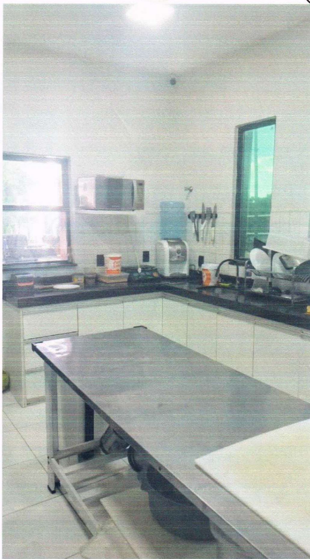
VILA SPORT ALIMENTAÇÕES LTDA | CNPJ: 49.522.789/0001-30 Rua Humberto de Campos, nº 1610, Planalto, Crateús - CE, 60.810-350